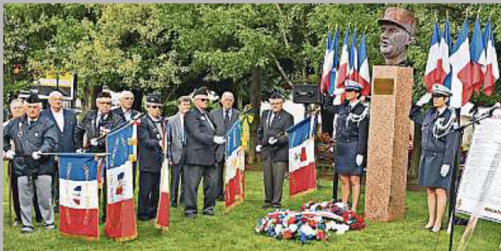
Am 8. Mai versammelt sich St. Maur am Kriegerdenkmal.

In der Nacht zum 8. Mai 1945 wurde in Reims die „bedingungslose Kapitulation der deutschen Wehrmacht“ unterzeichnet. Um 15 Uhr desselben Tages ließ General de Gaulle im ganzen Land die Glocken läuten, um das Ende des Zweiten Weltkrieges zu verkünden. Der französische Präsidenten Francois Mitterrand erklärte den 8. Mai ab 1982 zum nationalen Feiertag in Frankreich. Normalerweise würde an diesem Tag in Pforzheims Partnerstadt Saint Maur eine Zeremonie beim Kriegerdenkmal auf dem Friedhof stattfinden, mit Kranzniederlegung durch die Vertreter der Stadt, die Entzündung der Flamme zum ewigen Gedenken an den unbekanntem Soldaten, meist mit Unterstützung